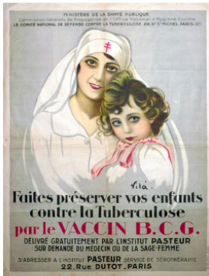
Figure 2 : Affiche de propagande pour le BCG

Des visites guidées organisées se feront dans le cadre des journées du patrimoine le samedi et le dimanche de 9 h 30 à 11 H 30 et de 14 h à 16 h, par groupe de 14 personnes, uniquement sur inscription (Tél. 06 63 02 57 42). Elles pourront s'organiser pendant quelques semaines, par petits groupes et sur rendez-vous.